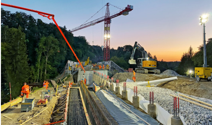
Die Pfähle (25 m³) werden bereits genutzt, während die Stützmauer für das Betonieren vorbereitet wird.