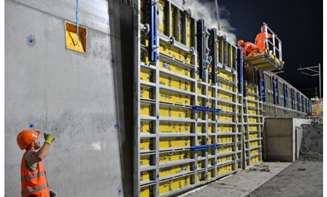
Stützmauer: Ausschalen 6 h nach Betonieren