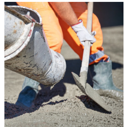
Pumpbeton für Brückentrog

Der Brückentrog einschliesslich der Bordüre, wurde in einem Arbeitsgang von 570 m³ betoniert. Der Beton wurde in zwei verschiedenen Konsistenzen geliefert und konnte somit sowohl gepumpt als auch mit Hilfe eines Krans eingebaut werden. Aufgrund des engen Lieferzeitplans wurden zwei Betonmischanlagen gleichzeitig für die Produktion eingesetzt. Dies erforderte eine sehr gute logistische Abstimmung. Deshalb produzierte jede Anlage Beton nach einer festgelegten Rezeptur für das jeweilige Bauteil – Stützwand und Pfähle, sowie Brückentrog inklusive Bordüre.