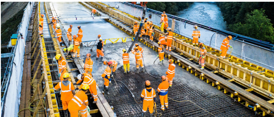
Betonierung von Brückentrog und Bordüre 570 m³